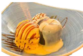
397.Soufflé de chocolate 5.95 €