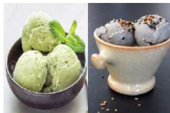
386.Matcha bola 387.Sesamo bola 3.75 €