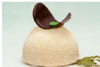
383.Coco amb cor de te verd 5.65 €