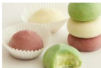
Mochi 394.Macha 5.25 € 395.Chocolate 5.25 € 396.Fresa 5.25 €