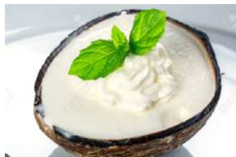
388.Coco helado 4.95 €