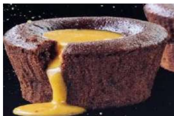
389.Soufflé de Baileys con helado 5.95 €