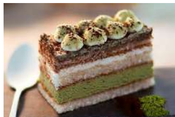
385.Tiramissu de te verd 6.85 €