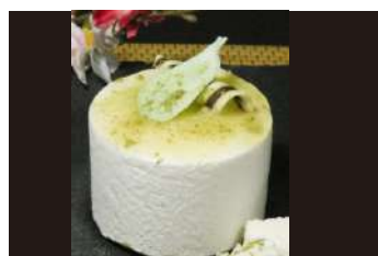
398.Cheesecake té matcha 5.85 €