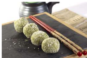
390.Trufes de coco i te matcha 5.65 €