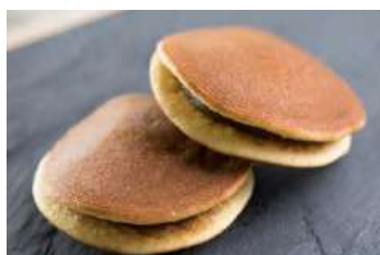
Dorayaki de chocolate 392.1u 3.25 € 393.2u 5.95 €