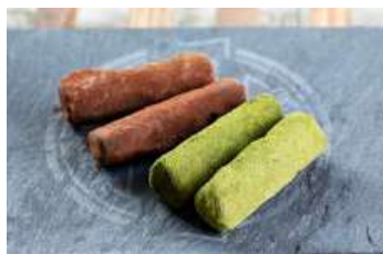
381.Trufes japoneses de sake i te matcha 3.95 €