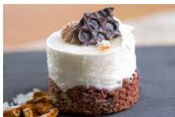
384.Brownie nous i coco 5.85 €